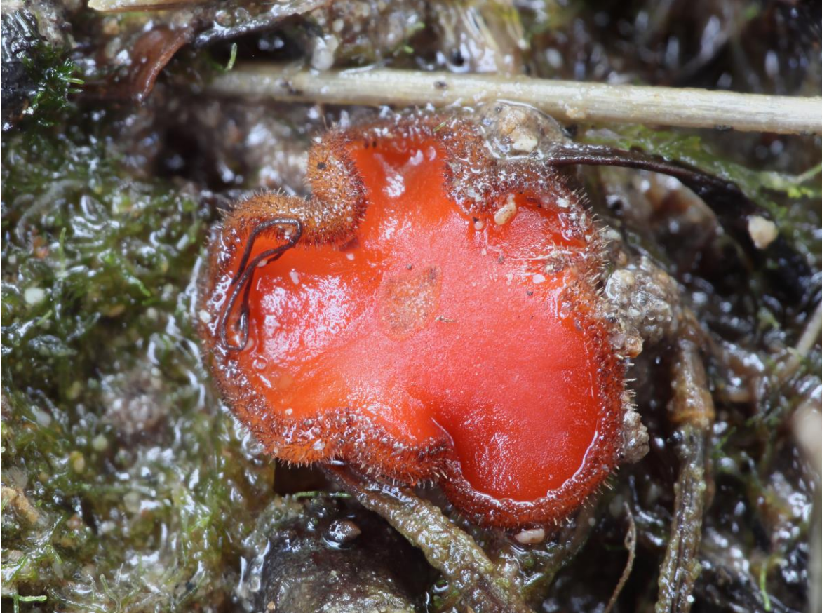
Scutellinia umbrorum (Fr.) Lambotte