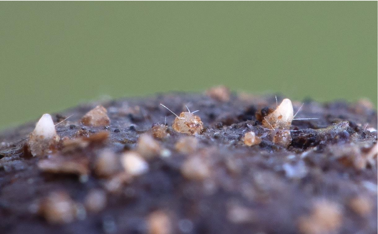
Trichobolus zukalii (Heimerl) Kimbr.