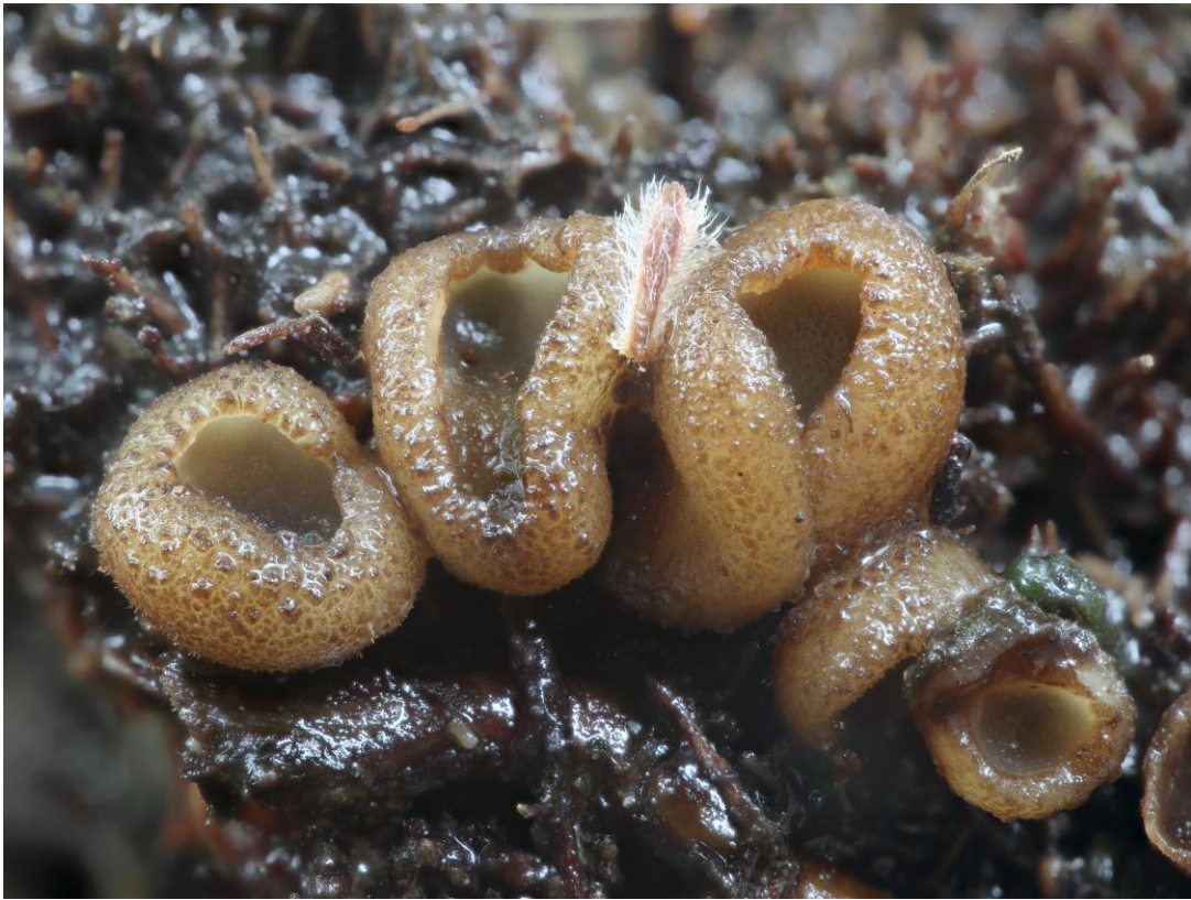
Geopora arenicola (Lév.) Kers