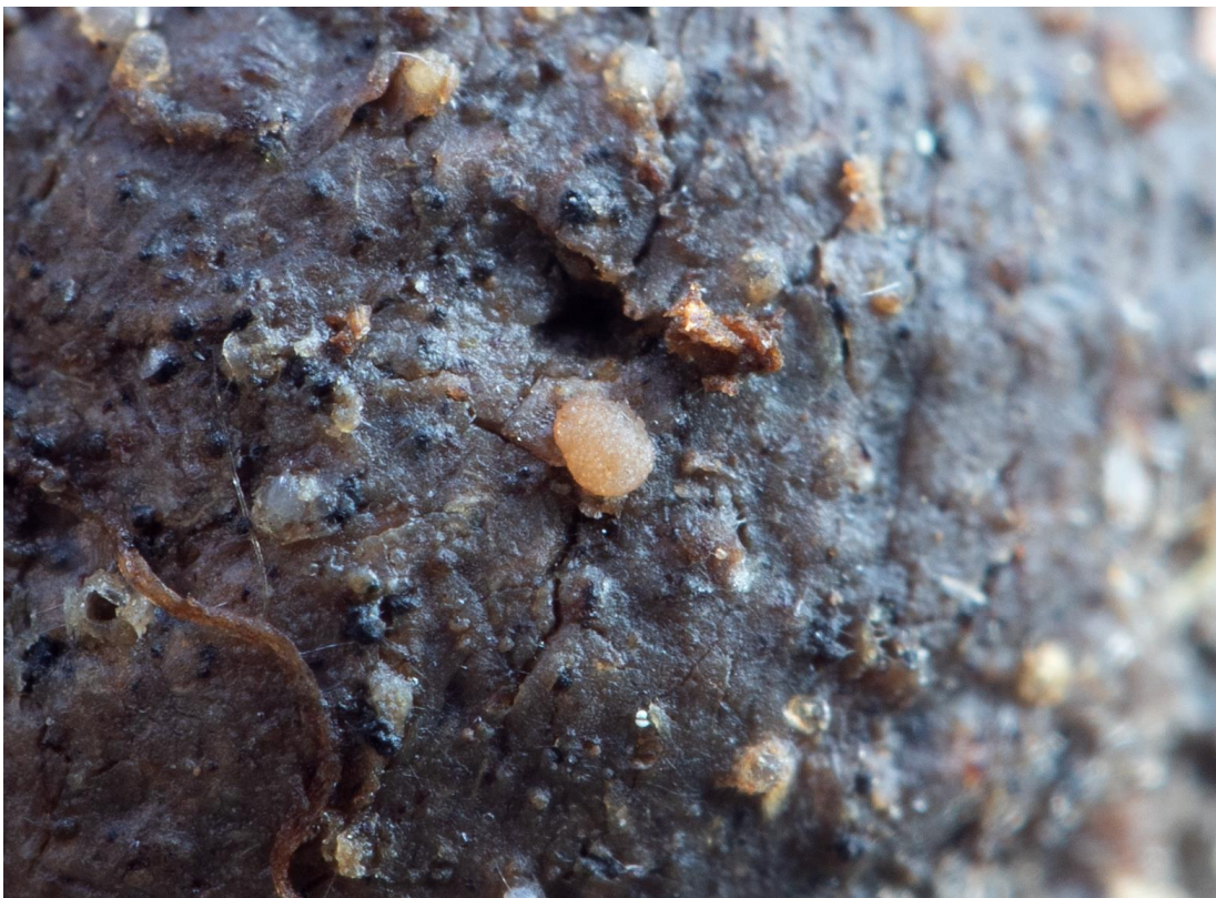
Coprotus aurora (P. Crouan & H. Crouan) K.S. Thind & Waraitch