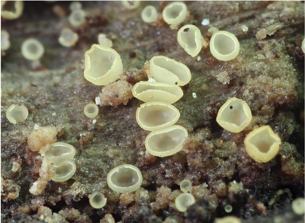
Calyptella capula (Holmsk.) Quél.