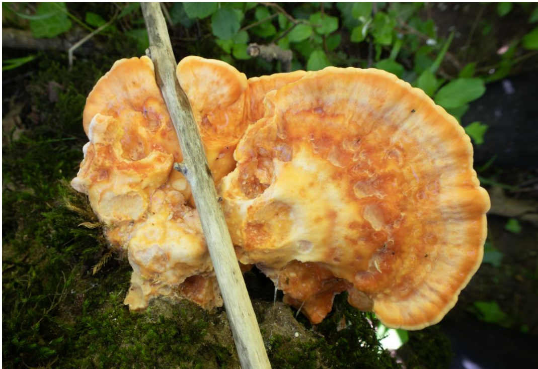
Laetiporus sulphureus (Bull.) Murrill