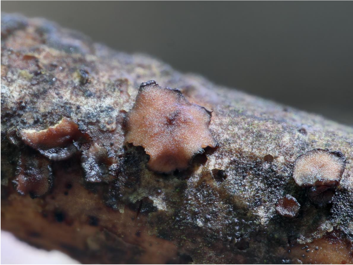
Rutstroemia punicae B. Perić