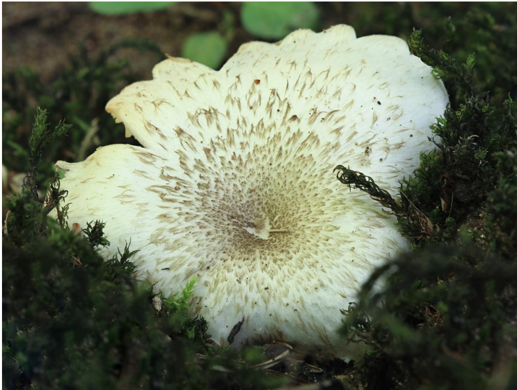
Lentinus tigrinus (Bull.) Fr.