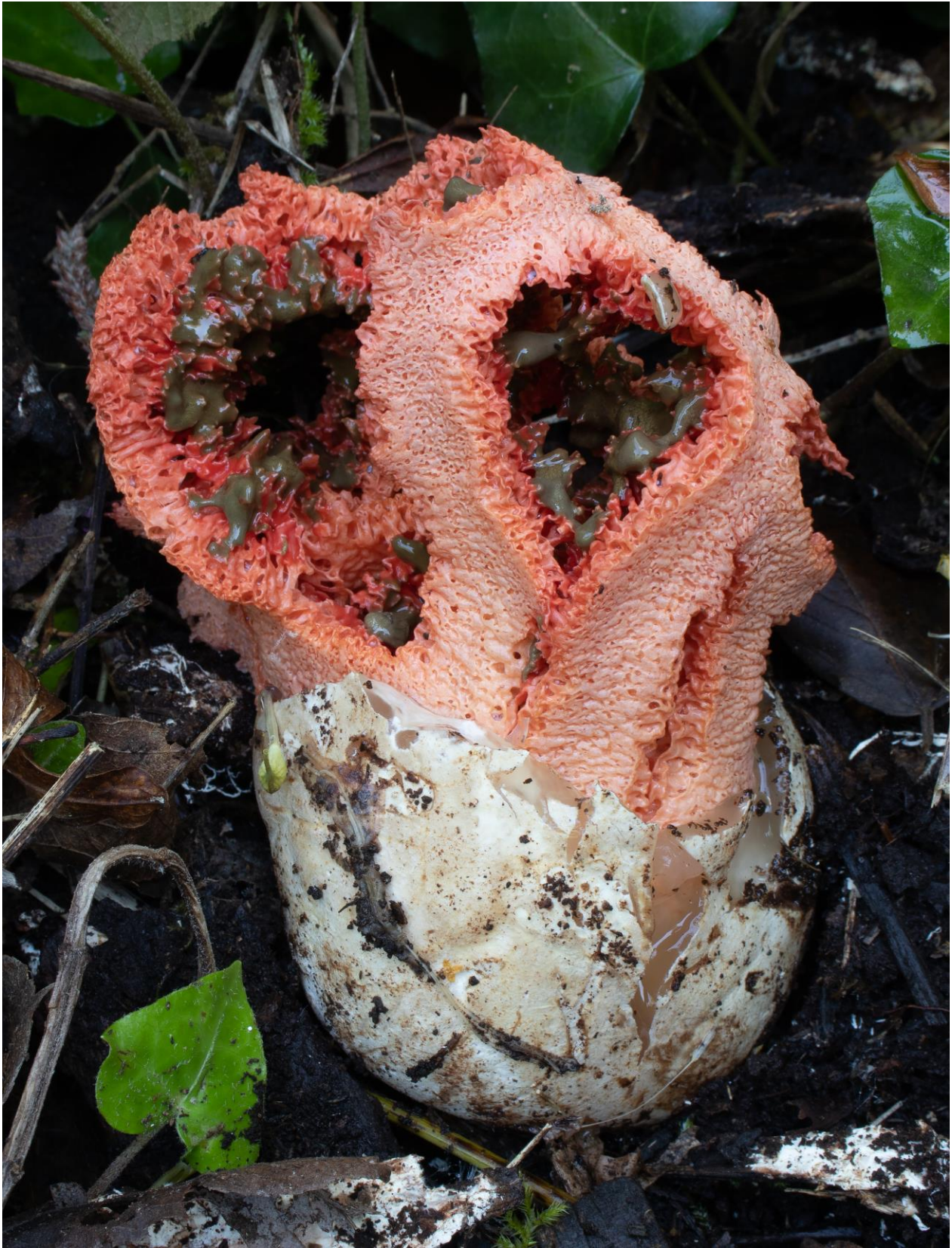
Clathrus ruber P. Micheli ex Pers.