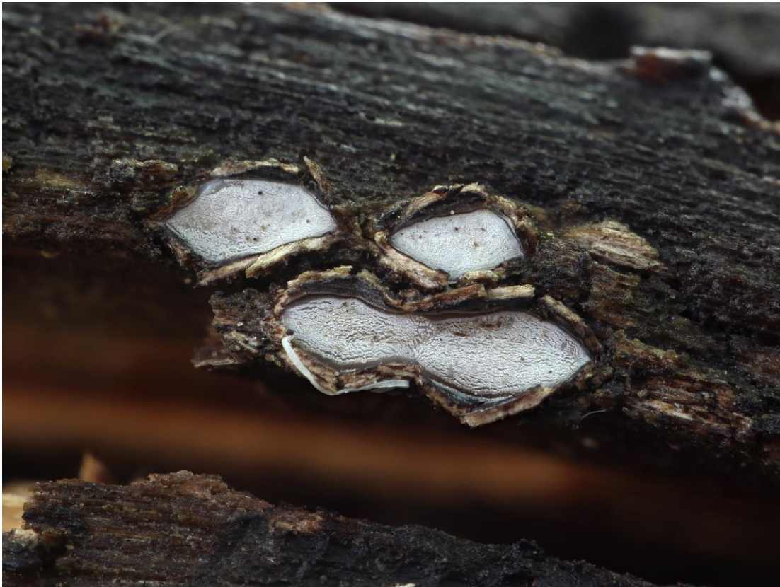
Propolis farinosa (Pers.) Fr.