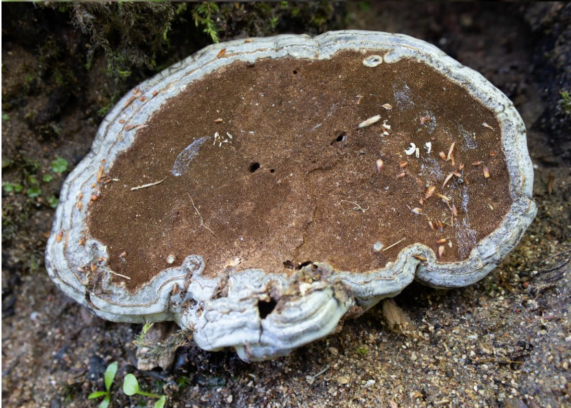
Ganoderma applanatum (Pers.) Pat.